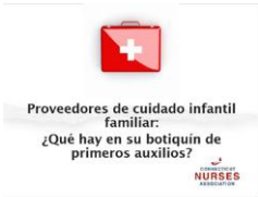
Proveedores de cuidado infantil familiar: ¿Qué hay en su botiquín de primeros auxilios?