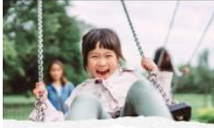
Active Supervision in Far Child Care