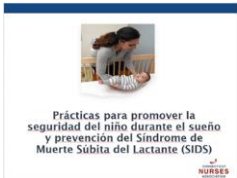
Prácticas para promover la seguridad del niño durante el sueño y prevención del Síndrome de Muerte Súbita del Lactante (SIDS)