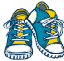
go for a walk