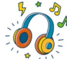
listen to music