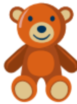
abrazar mi peluche favorito