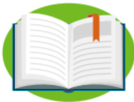
leer un libro