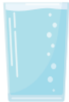
tomar una bebida