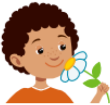
take deep breaths