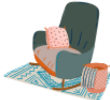
take a break