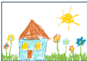
draw a picture