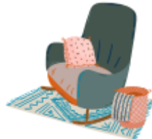
tomar un descanso